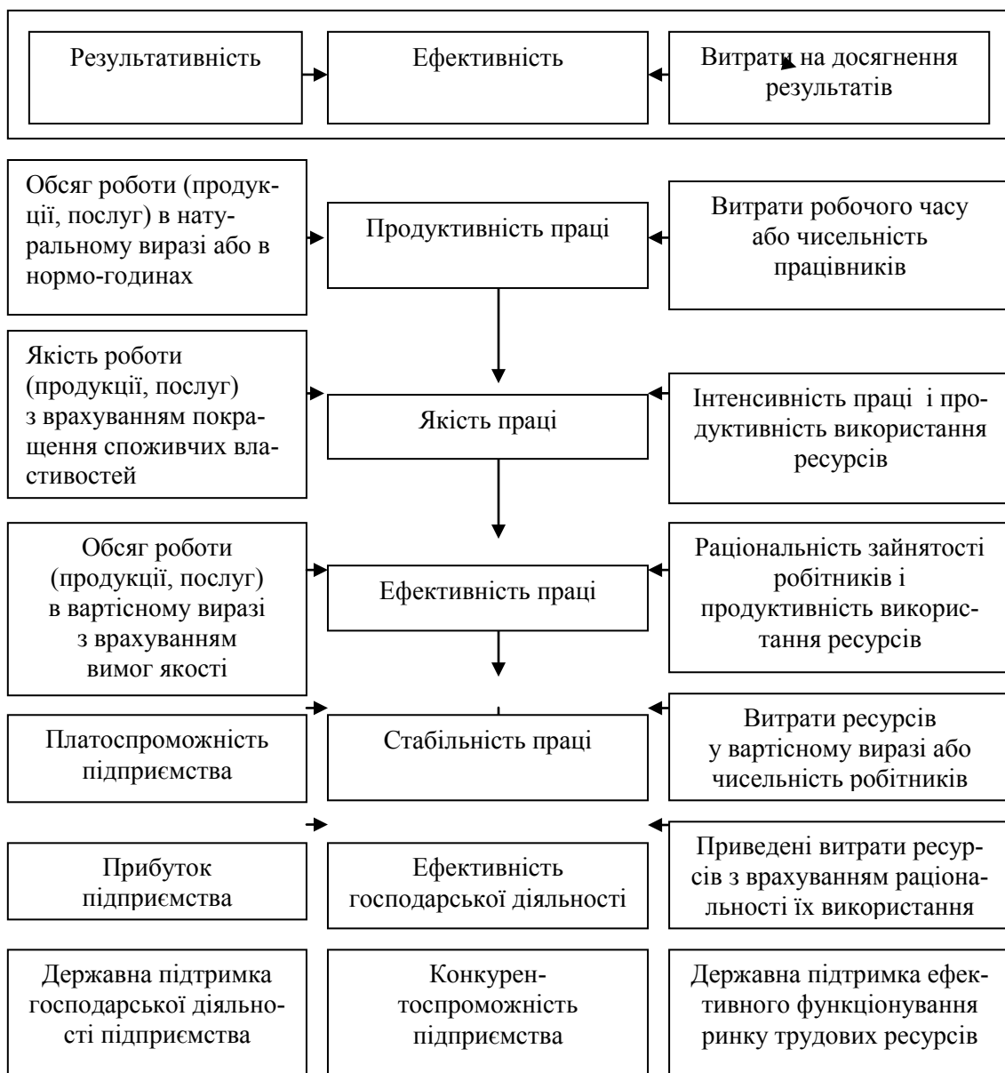
Рисунок 1.1 – Система показників, які характеризують ефективність трудової діяльності