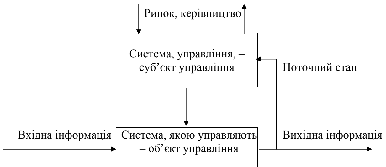
Рисунок 1.2 – Структура системи управління підприємством

Розглянемо поняття економічної інформації на прикладі системи управління підприємством (рис.1.2).