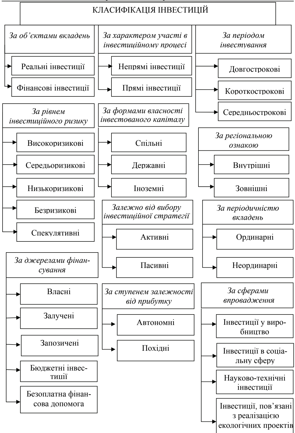
Рис. 1.2. Класифікація інвестицій (складено за даними [133; 11; 12; 103; 126; 172; 173; 179; 193; 196])