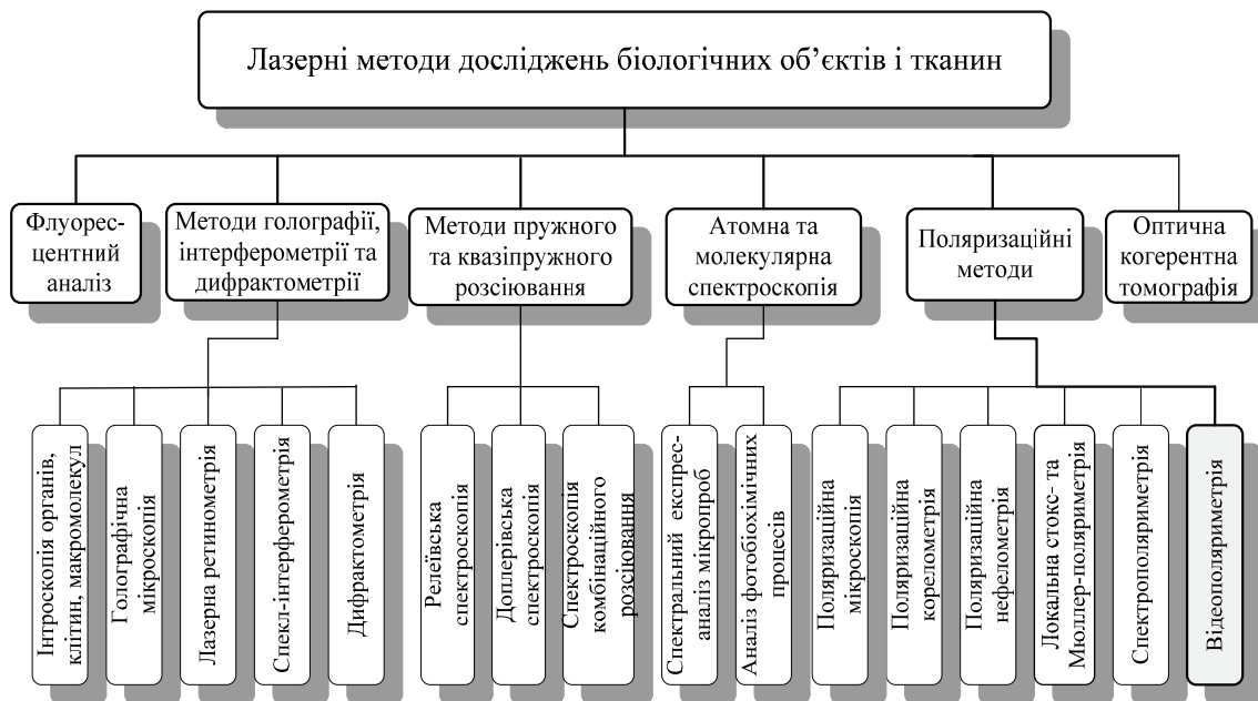
Рис. 1.1. Класифікація лазерних методів досліджень біологічних об'єктів і тканин

На дослідженні кутових і поляризаційних характеристик пружно розсіяного світла засновані лазерні нефелометричні системи діагностування біологічних об'єктів та тканин [7, 13]. Для виявлення частинок різних розмірів використовують метод асиметрії індикатриси (полягає у реєстрації відхилення вимірюваної індикатриси від індикатриси релєївського розсіювання) та метод повної індикатриси, який застосовується для дослідження частинок із розмірами 0,1–10 мкм (при малокутовому розсіянні 1–300 мкм) [7, 13, 16].