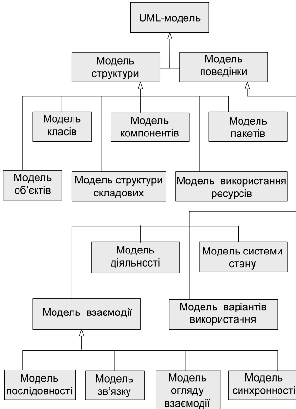
Рис. 1.3. Структура моделей UML 2.x