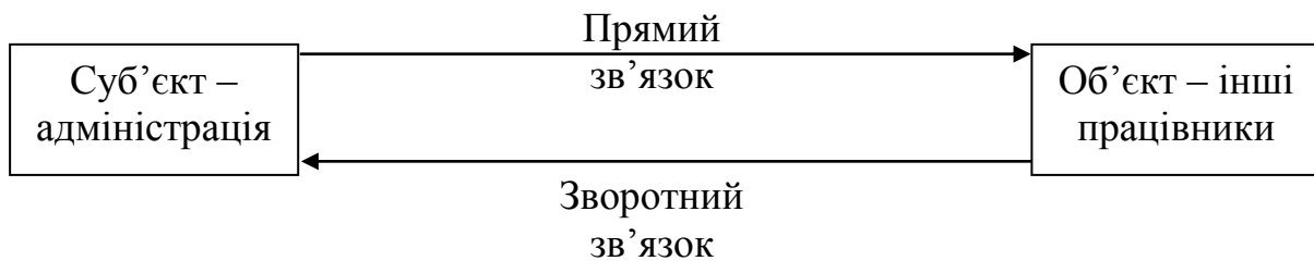
Рисунок 1.1 – Взаємодія суб'єкта і об'єкта управління персоналом

Між суб'єктом та об'єктом існує прямий та зворотний зв'язки (рис. 1.1).