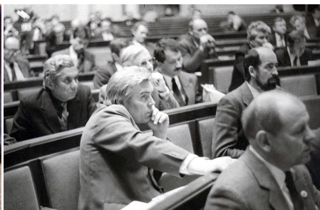
Світлина 8. 1991 р.

Посвідчення і нагрудні знаки народного депутата УРСР та України