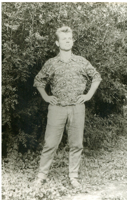
Світлина 2. 1961 р. Перша весна у Кривому Розі

він був відомий у Жашкові ще й як центрфорвард футбольної збірної команди Жашківського району, що брала участь у першості Черкаської області, а також як центрфорвард футбольної команди тресту «Криворіжаглобуд», що брала участь у першості Кривого Рогу та футбольної команди комбінату «Криворіжбуд», що брала участь у першості України серед колективів спортивного товариства «Трудові резерви».