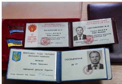
Світлина 7. 1990-1994 рр.

Посвідчення і нагрудні знаки народного депутата УРСР та України