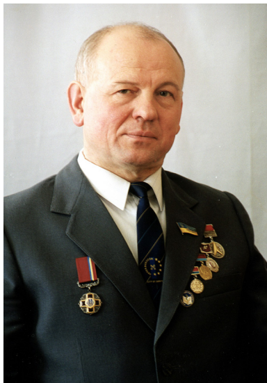
Світлина 14. 2003 р. Ректор ВНТУ, професор Борис Мокін, нагороджений орденом «За заслуги» III-го ступеня

представник науковців України, виступає з науковими доповідями на Міжнародних Конгресах ІМЕКО в італійському Туріні, фінському Тампере та австрійському Відні. Але і громадську та журналістську діяльність Борис Мокін у цей період не полишає – він продовжує писати та публікувати книги зі своєї історико-публіцистичної серії і здійснює керівництво Вінницьким відділенням Всеукраїнського об'єднання «Злагода». За сукупністю досягнутих результатів, ректор ВДТУ, академік НАПНУ, АІНУ, АГНУ, професор Борис Мокін, який у цей період ще й був обраний від України академіком Міжнародної академії наук вищої школи з центром у Москві, яка об'єднала професорів 40 країн, у 2000 році указом президента України нагороджений орденом «За заслуги» III ступеня.