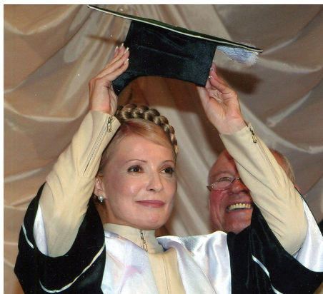
Світлина 16. 2007 р. Вручення Юлії Тимошенко атестату і мантиї Почесного професора ВНТУ

викладачів потім надати можливість тим двом з половиною тисячам із них після повернення їх з Київського Майдану в аудиторії відпрацювати пропущені заняття у другій половині дня. Але з часом він розчарувався в спроможності Віктора Ющенка керувати країною і на дострокових, і парламентських виборах 2007 року уже підтримував опозиційного лідера партії «Батьківщина» Юлію Тимошенко, яка відвідала університет напередодні виборів і яка була приємно вражена як запровадженням у ньому підготовки фахівців на основі поєднання канадських та європейських стандартів вищої освіти, так і тим, що Вчена рада ВНТУ після її виступу на засіданні ради одноголосно проголосувала за присвоєння їй – кандидату економічних наук звання «Почесний професор ВНТУ». Юлія Тимошенко ще тоді пообіцяла, що в разі перемоги на парламентських виборах її партії, що дасть змогу їй очолити уряд нашої країни, вона обов'язково візьме до себе в радники з питань вищої освіти на громадських засадах такого прогресивного