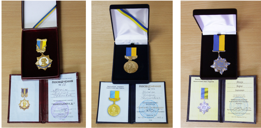
Світлина 20. 2012 р. Академічні медалі «Ушинський К. Д.», «Григорій Сковорода» та пам'ятна медаль до 20-річчя НАПН України