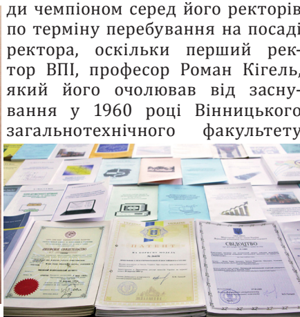
Світлина 24. Монографії, посібники, патенти та авторські свідоцтва професора Бориса Мокіна