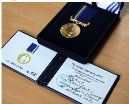
Світлина 10. Золота медаль Української журналістики Бориса Мокіна