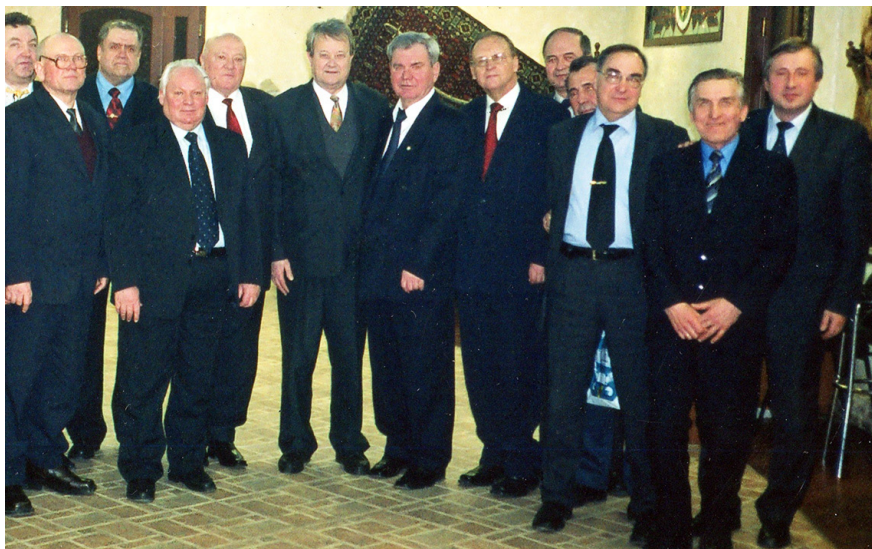
Світлина 15. 2004 р. Ректор ВНТУ, професор Борис Мокін в Одесі серед учасників Підсумкової колегії МОН України

представник науковців України, виступає з науковими доповідями на Міжнародних Конгресах ІМЕКО в італійському Туріні, фінському Тампере та австрійському Відні. Але і громадську та журналістську діяльність Борис Мокін у цей період не полишає – він продовжує писати та публікувати книги зі своєї історико-публіцистичної серії і здійснює керівництво Вінницьким відділенням Всеукраїнського об'єднання «Злагода». За сукупністю досягнутих результатів, ректор ВДТУ, академік НАПНУ, АІНУ, АГНУ, професор Борис Мокін, який у цей період ще й був обраний від України академіком Міжнародної академії наук вищої школи з центром у Москві, яка об'єднала професорів 40 країн, у 2000 році указом президента України нагороджений орденом «За заслуги» III ступеня.