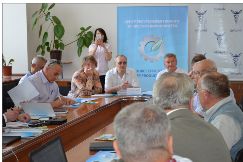
Діалог державних управлінців, підприємців та науковців Вінницького регіону з представниками Університету Організації Об'єднаних Націй по впровадженню в Україні проекту «Ресурсоефективне та чисте виробництво», м. Вінниця, 2015 р.