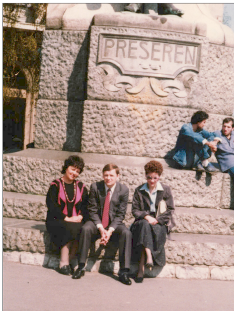
З колегами на екскурсії під час наукового стажування в Люблянському університеті ім. Е. Карделя, Словенія, 1987 р.