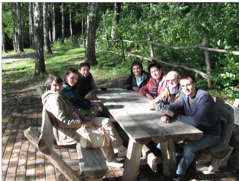
На відпочинку з колективом кафедри хімії та хімічної технології ВНТУ, Вінницька обл., 2013 р.