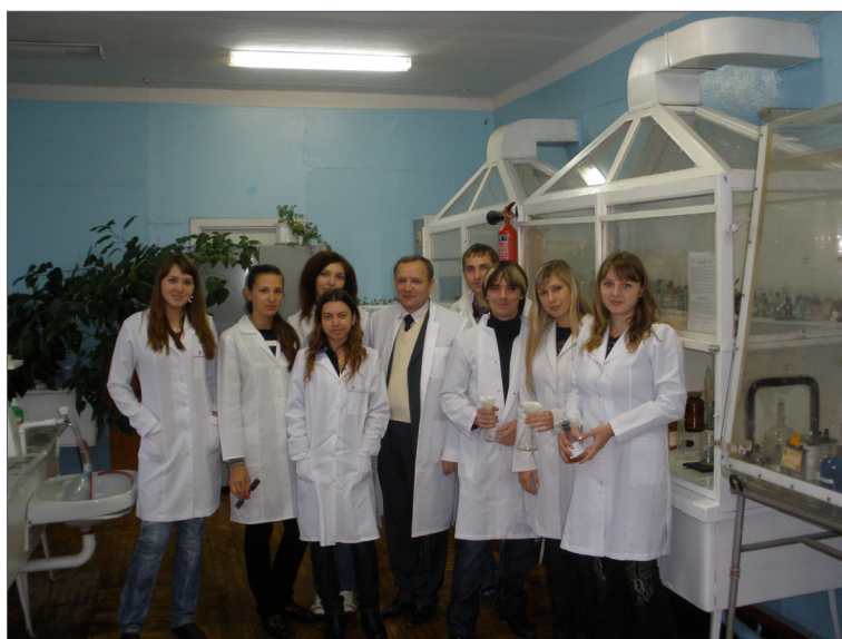
З студентами-екологами Вінницького національного технічного університету, 2008 р.