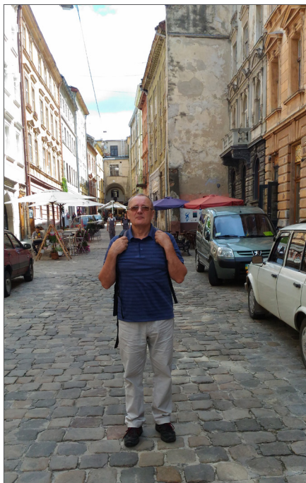
На екскурсії історичним Львовом, 2018 р.