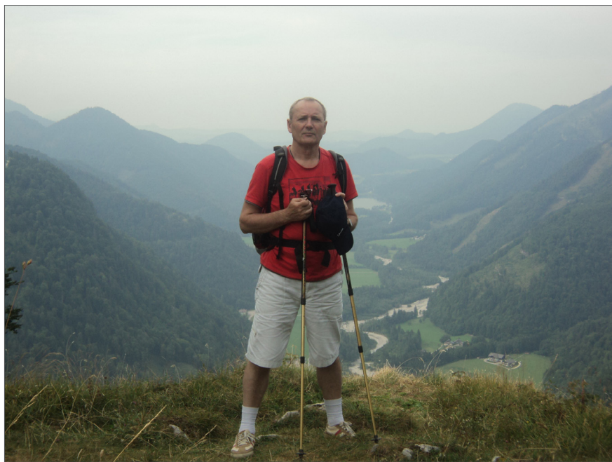
На відпочинку в Альпах, 2013 р