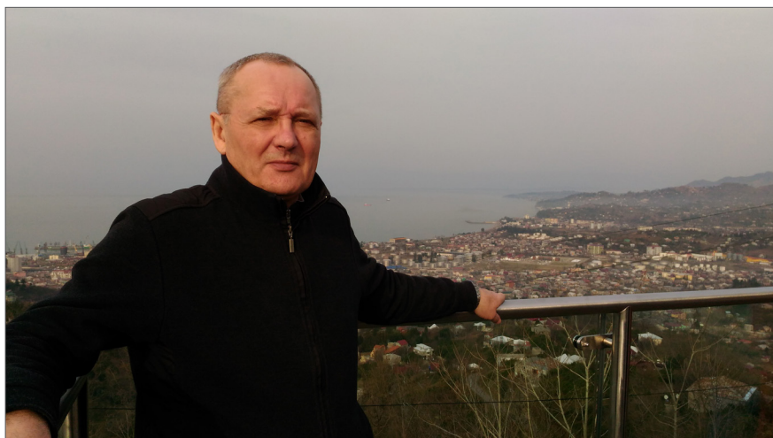
На відпочинку у Грузії, м. Батумі, 2017 р.