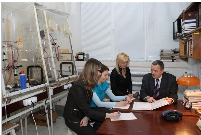
З молодими науковцями в науково-дослідній лабораторії технологічних процесів та синтезу напівпродуктів кафедри хімії та хімічної технології ВНТУ, 2009 р.