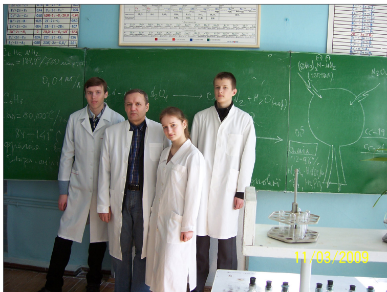
Під час підготовки до республіканського туру з учнями середньої школи – переможцями обласної олімпіади з хімії, м. Вінниця, 2009 р