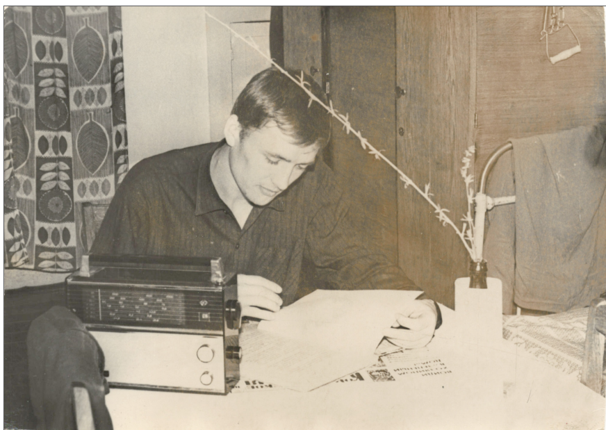
У студентському гуртожитку під час навчання у Дніпропетровському хіміко-технологічному інституті (ДХТІ), 1972 р.