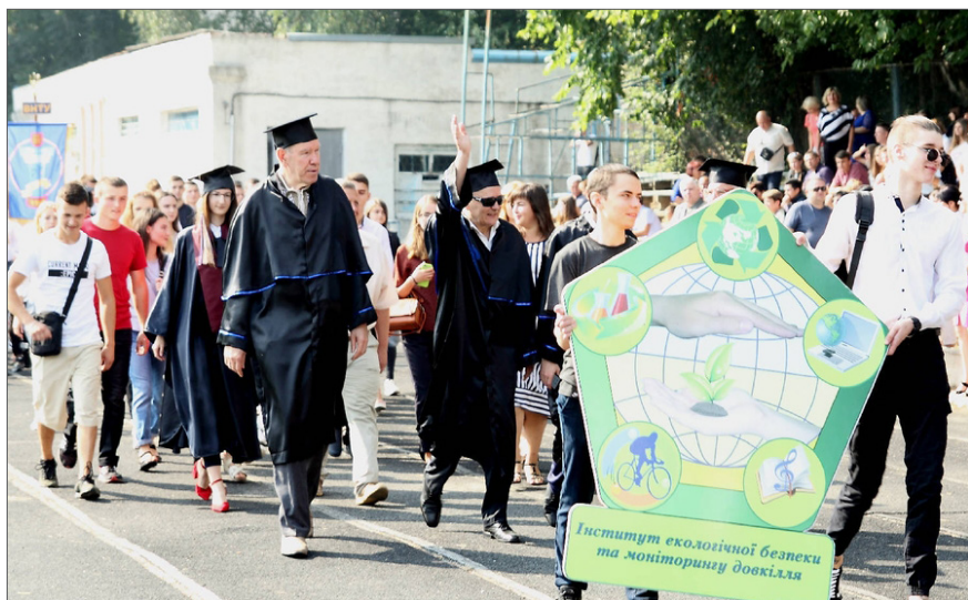
На урочистій посвяті в студенти ВНТУ майбутніх екологів, 2019 р.