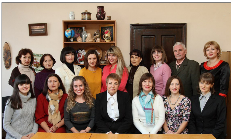
Колектив кафедри мовознавства, ВНТУ