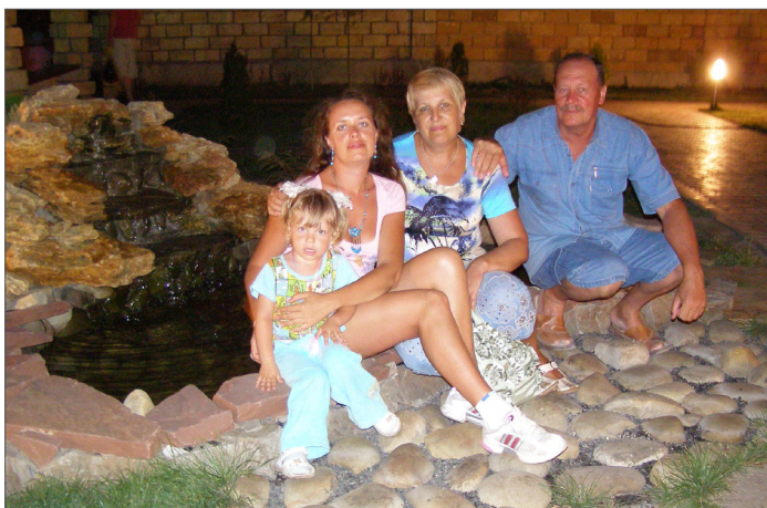
Три покоління Азарових...