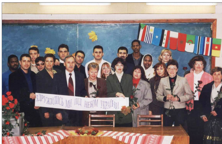
На святкуванні Міжнародного дня рідної мови. ВНТУ, 2005 р.