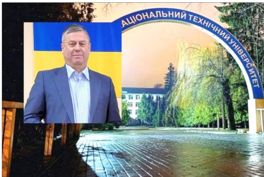
Ректор ВНТУ Віктор Біліченко увійшов до рейтингу найкращих ректорів та університетів «The World Rating of the Best Chancellors and Universities» у 2023 та 2024 рр.