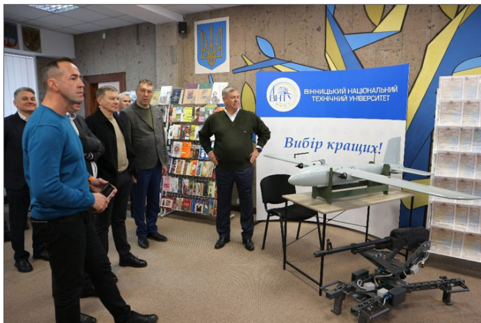
Засідання Наглядової ради університету. Виставка досягнень науковців та студентів ВНТУ, 2023 р.