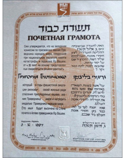
Дідусь Григорій Біліченко – праведник народів світу