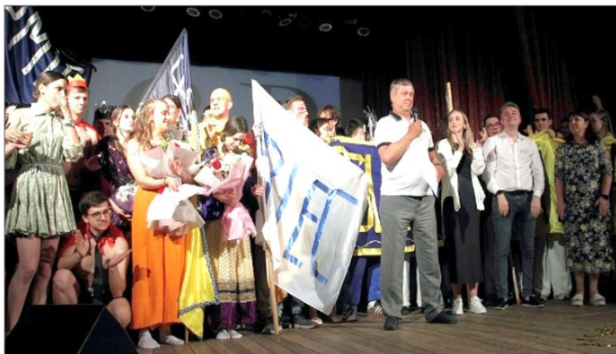
«Студентська весна-2024» у ВНТУ. Нагородження переможців