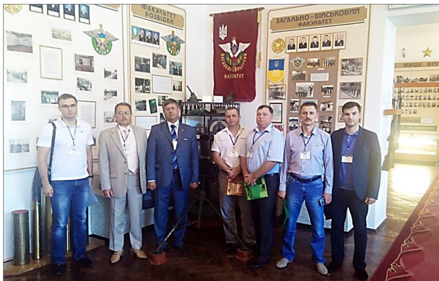
Всеукраїнська науково-практична конференція «Новітні шляхи створення, технічної експлуатації, ремонту і сервісу автомобілів». Одеса, 2015 р.