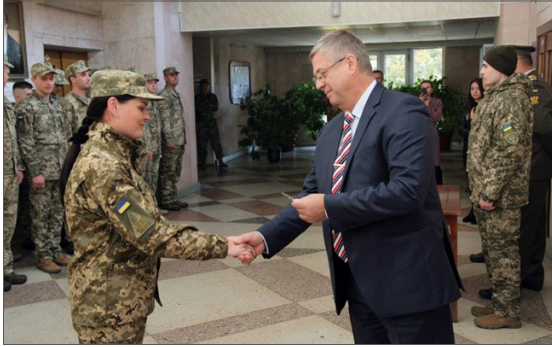
Урочисте вручення офіцерських погонів випусникам військової кафедри ВНТУ, 2021 р.