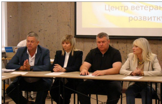
На фото зліва направо: ректор ВНТУ В. В. Біліченко, заст. міського голови Вінницької міськради Г. А. Якубович, голова Вінницької облради В. П. Соколовий, перший заст. нач. Вінницької ОВА