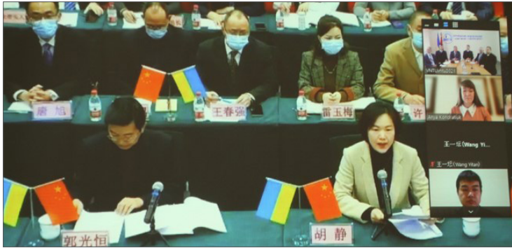
Підписання угоди між ВНТУ та Будівельно-інженерною школою Паньцжихуа (КНР), 2022 р.