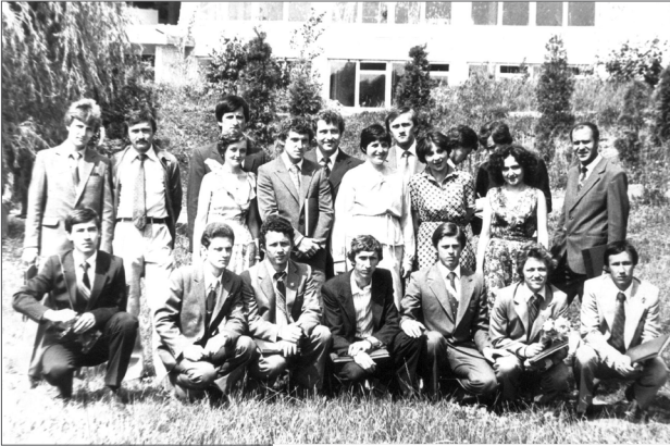
З однокурсниками. Фото на згадку під час навчання у ВПІ (1976-1981 рр.)