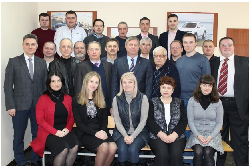
Колектив кафедри автомобілів та транспортного менеджменту, 2019 р.