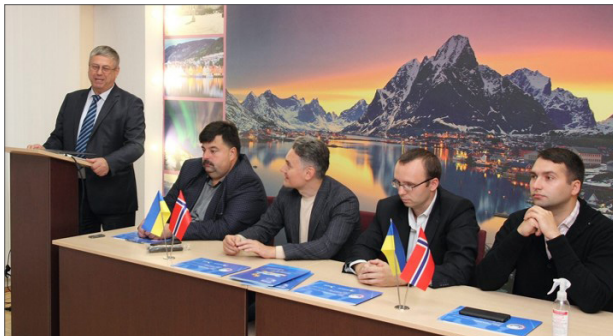
Відкриття курсів «Підприємництво та інформаційні технології в бізнесі» від проєкту «Норвегія-Україна», 2021 р.