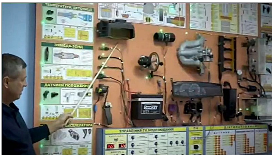
Проф. В. Біліченко читає лекцію з технічної експлуатації автомобілів, 2014 р.