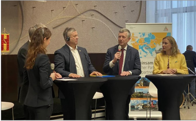
Ректор ВНТУ В. В. Біліченко на підписанні меморандуму про співпрацю з Технологічним університетом міста Карлсруе (Німеччина), 2023 р.