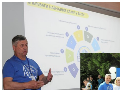
На Дні відкритих дверей ВНТУ-2024