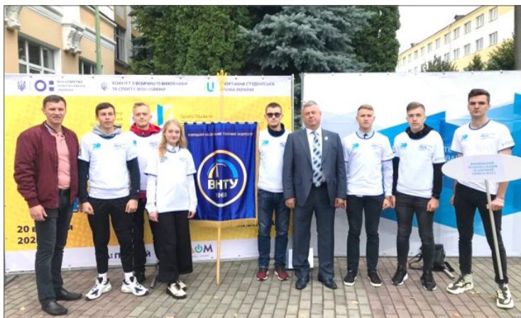
На святкуванні Міжнародного дня студентського спорту. ВДПУ, 2021 р.