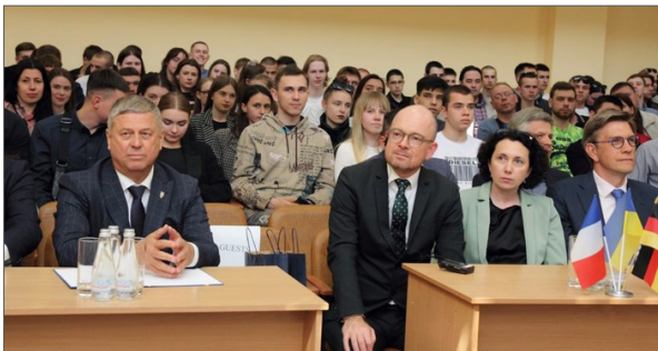
На зустрічі з делегаціями Франції та Німеччини (країн – засновниць Європейського Союзу), які відвідали ВНТУ з партнерським візитом, 2024 р.