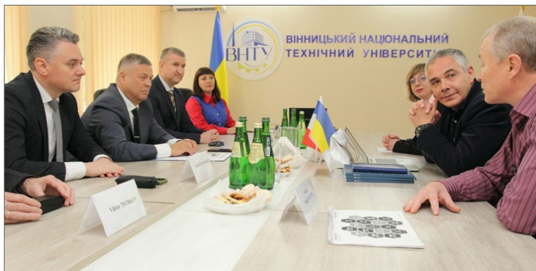
Зустріч адміністрації ВНТУ з делегацією міста Діжон та регіону Бургундія-Франш-Конте, 2024 р.