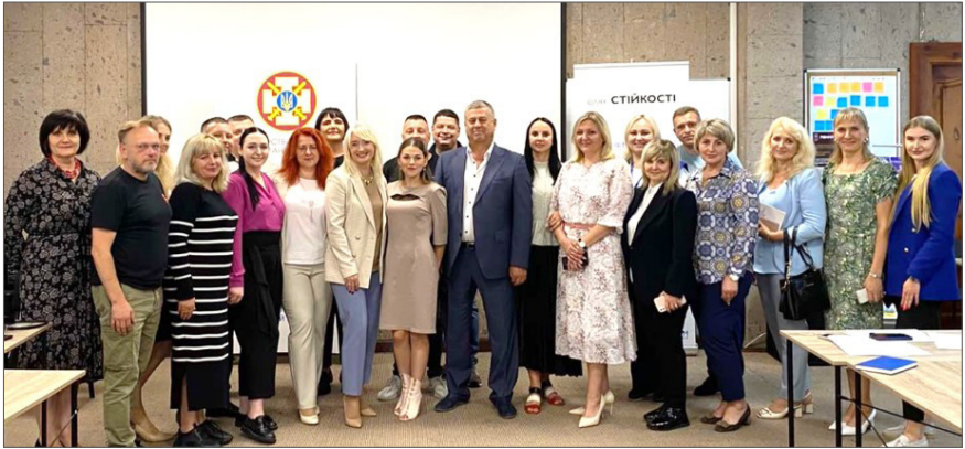
Створення Центру ветеранського розвитку на базі ВНТУ, 2023 р.