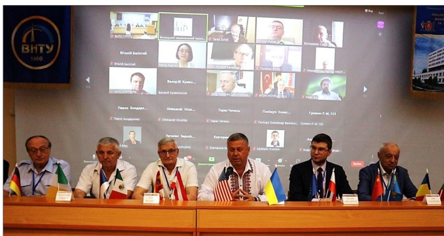
Міжнародна науково-технічна конференція «Перспективи розвитку машинобудування та транспорту-2023»