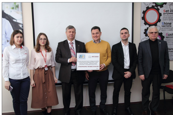
Відкриття лабораторії Автомир-Вінниця у ВНТУ, 2017 р.