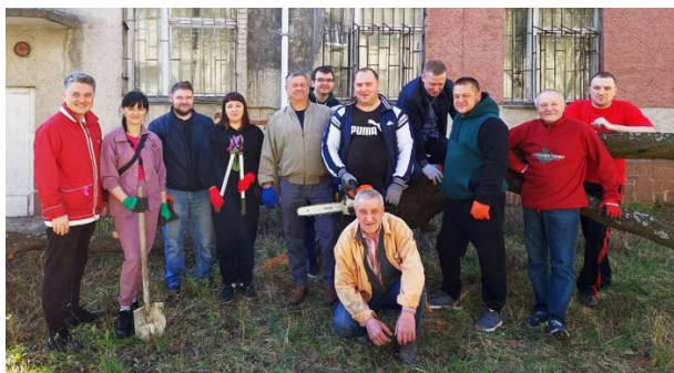
На суботній толоці у ВНТУ, 2024 р.